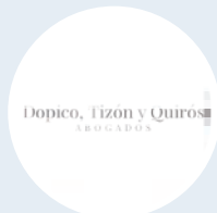
Dopico, Tizón y Quiros Abogados Entorno Legal