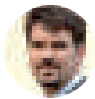
Guillermo del Haro Modelos de negocio e plan estratéxico dixital