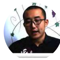
Ziyang Zhan Negociación